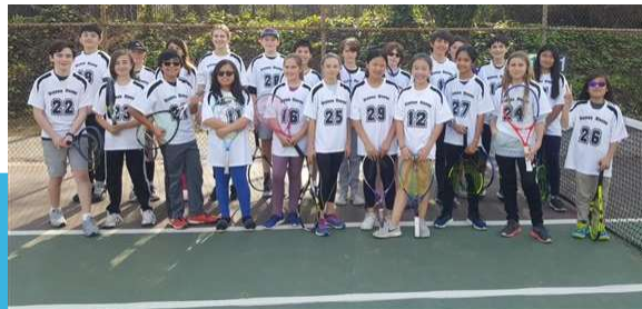
OCT. 2023