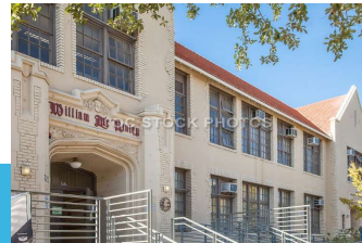
(C) PASADENA EDUCATION NETWORK (PEN) WWW.PENFAMILIES.ORG - OCT. 2023