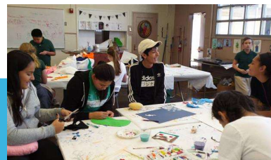
(C) PASADENA EDUCATION NETWORK (PEN) WWW.PENFAMILIES.ORG - OCT. 2023