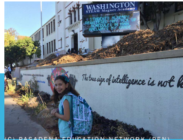
(C) PASADENA EDUCATION NETWORK (PEN) WWW.PENFAMILIES.ORG - OCT. 2023