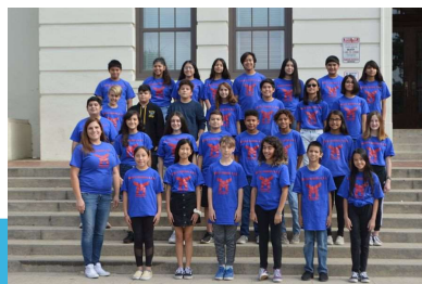
(C) PASADENA EDUCATION NETWORK (PEN) WWW.PENFAMILIES.ORG - OCT. 2023